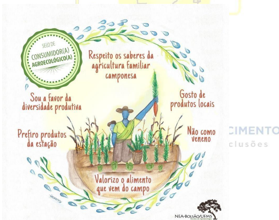
Figura 1: Selo de Consumidor(a) Agroecológico (a).

Destaca-se a importância do termo “consumidores-apoiadores”, que pretende evidenciar uma nova relação consumidor/agricultor, baseada na colaboração mútua em benefício de um projeto coletivo de produção e consumo agroecológico, bem como de apoio a reforma agrária, dando um caráter de parceria nas relações de produção e consumo, visando romper a lógica mercadológica do capital. A fim de reforçar o protagonismo dessa identidade, foi criado um selo de identidade de consumidor(a)-apoiador(a) agroecológico(a), pelo NEA-Bolsão/UFMS: