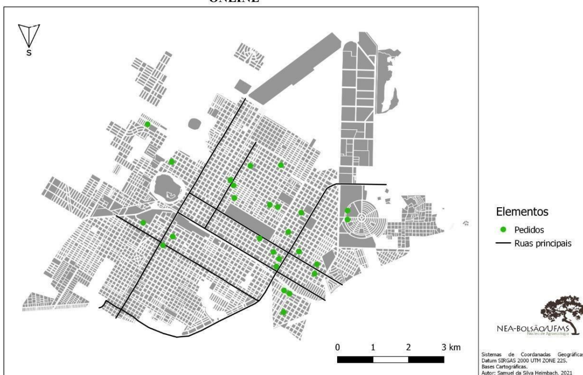
Mapa 1: Primeira Feira Online: espacialização na cidade de Três Lagoas-MS do Consumo Agroecológico (Março/2020). Fonte: Heimbach (2021).

E A TRANSFORMAÇÃO DO CONHECIMENTO Democracia • Políticas Públicas • Inclusões