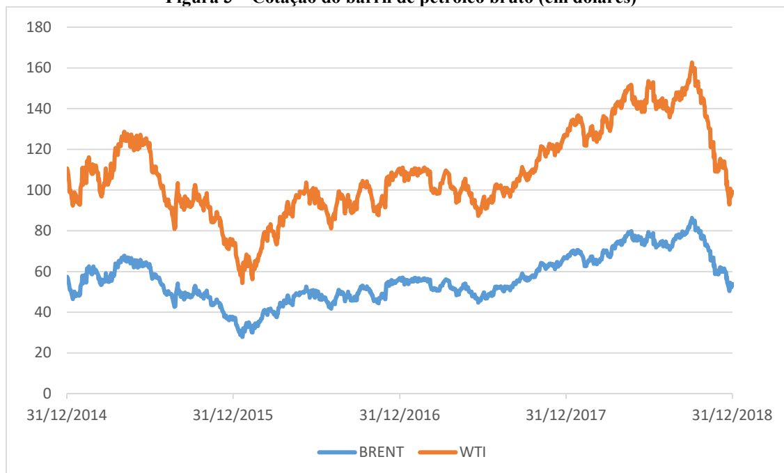
Figura 3 – Cotação do barril de petróleo bruto (em dólares)

A Figura 3, na sequência, indica as variações da cotação commodity base (petróleo) perante o período analisado que podem ter influenciado a variação dos custos com combustíveis e lubrificantes.