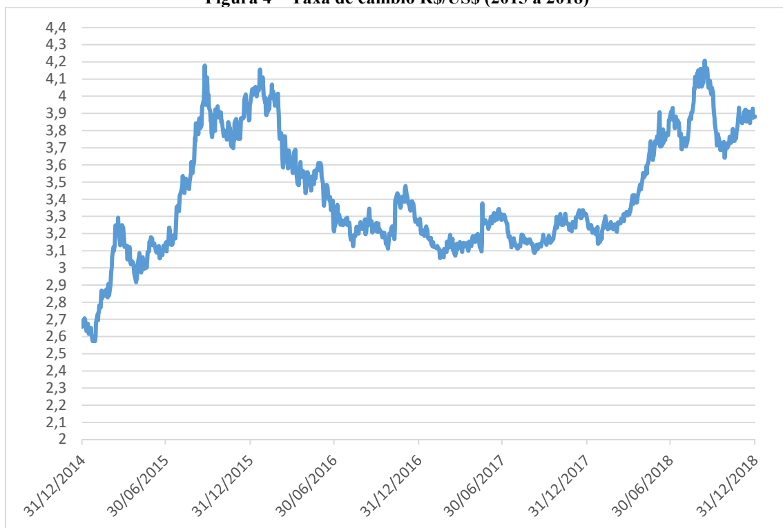
Figura 4 – Taxa de câmbio R$/US$ (2015 a 2018)